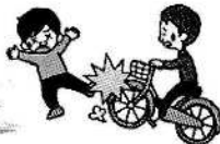
自転車で歩行人にけがをさせた