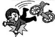
自転車で転んでのケガ