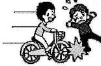
自転車にはねられてのケガ