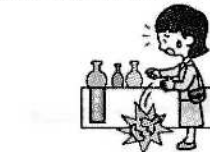
買い物中過って商品を壊した