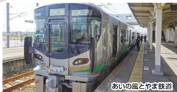
あいの風とやま鉄道